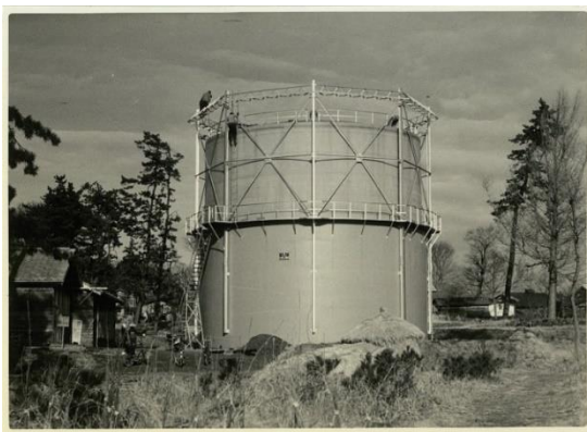
昭和33年竣工有水式ガスホルダー