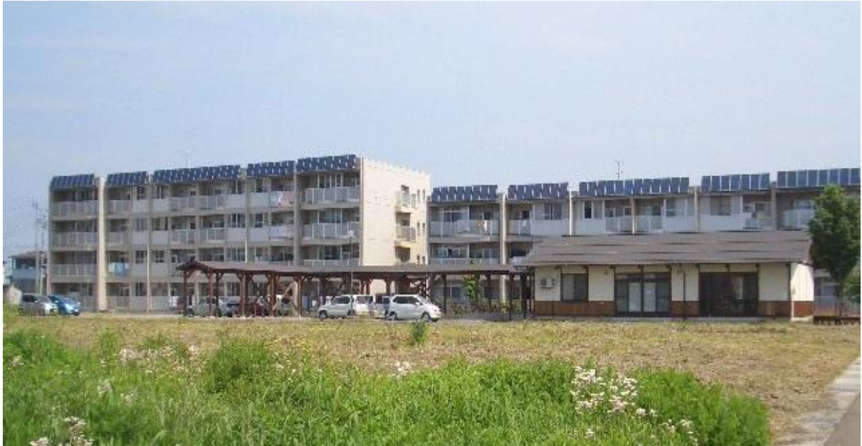
写真：市営子安住宅